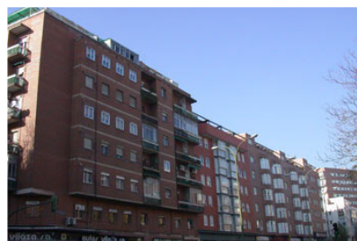
Les variacions en el preu de l'habitatge s'expressen també mitjançant percentatges