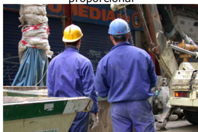
Per calcular la pujada salarial dels treballadors s'aplica un augment percentual