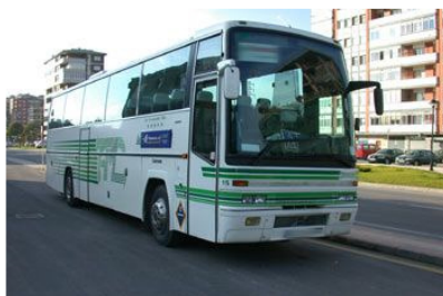
Calcular el preu d'una excursió és una activitat de magnituds inversament proporcionals