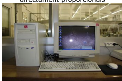
Repartir els beneficis d'un treball entre els realitzadors és un repartiment directament proporcional