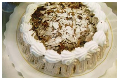
Elaborar una recepta de cuina és una activitat de magnituds directament proporcionals