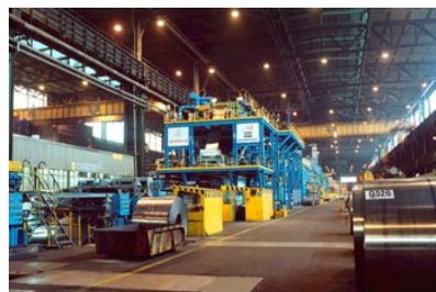
Planificar un treball per acabar-lo a temps és una activitat de proporcionalitat composta