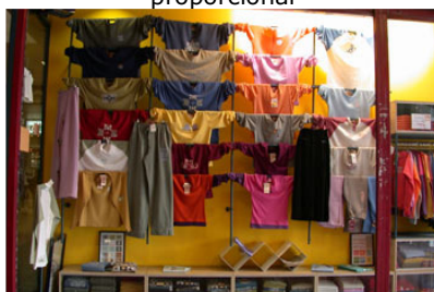
Les rebaixes en supermercats i comerços es calculen aplicant una disminució percentual