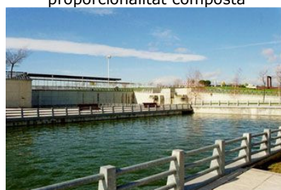
Per mesurar la capacitat d'un pantà o d'un dipòsit es fan servir percentatges