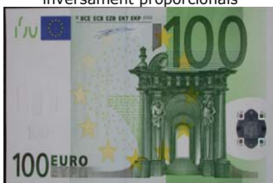
Repartir diners entre persones segons les seves necessitats és un repartiment inversament proporcional