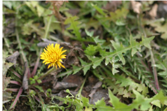
Diente de león