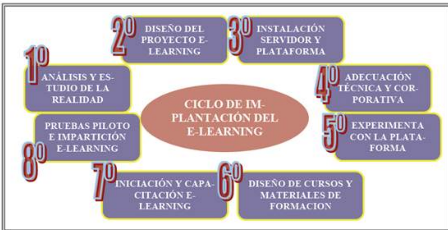
Imagen 1. Ciclo de Implantación E-learning. Sanchez (2007)

Un ejemplo claro del proceso a seguir para la implantación del e-learning en nuestra tarea diaria lo tenemos en el siguiente cuadro.