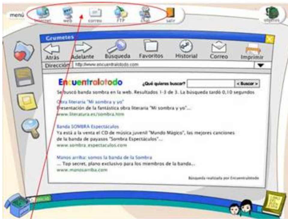
Bloques de contenido:

La aplicación se compone de cinco grandes bloques de contenidos, denominados: "Internet", "Web", "Correo", "FTP" y "Chat".