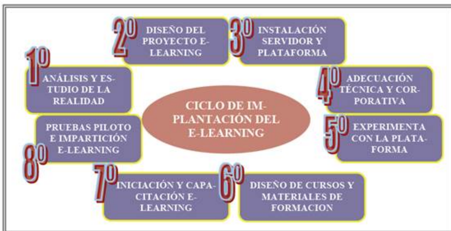
Imagen 1. Ciclo de Implantación E-learning. Sanchez (2007)

Un ejemplo claro del proceso a seguir para la implantación del e-learning en nuestra tarea diaria lo tenemos en el siguiente cuadro.