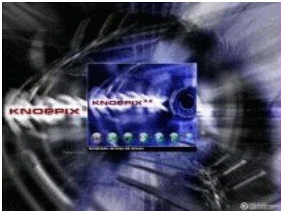
Imagen arranque Knoppix II

La distribución de Knoppix de Metadistros o la de Victor Alonso (al que agradezco su esfuerzo desde aquí) está configurada para que funcione en castellano desde el inicio sin tener que poner parámetros de configuración al inicio.