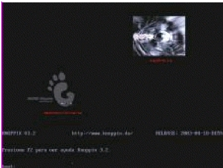
Imagen Inicio Knoppix

Una vez realizado lo anterior, una shell de inicio representada por boot (ver imagen) que nos indica que podemos introducir la secuencia de comandos de arranque de Knoppix.