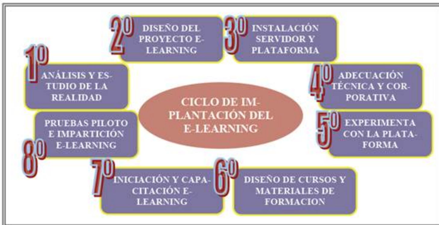
Imagen 1. Ciclo de Implantación E-learning. Sanchez (2007)

Un ejemplo claro del proceso a seguir para la implantación del e-learning en nuestra tarea diaria lo tenemos en el siguiente cuadro.