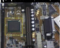
Fig 16. ChipSet