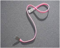
Fig 12. Cable de datos Serial ATA