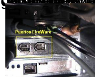
Fig 15. Puertos FireWire