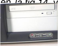
Fig 14. Puertos externos delanteros