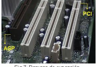
Fig 7 Ranuras de expansión

RANURAS DE EXPANSIÓN Permiten conectar dispositivos adicionales al sistema. Las ranuras de expansión que se muestran en la figura 6 son de tipo PCI y AGP.