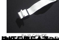
Fig 10 Cable IDE

DISPOSITIVOS DE ALMACENAMIENTO DE DATOS Los dispositivos de almacenamiento de datos se conectan a la placa base a través de los conectores IDE y SATA.