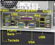
Fig 13. Conectores externos