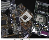
Fig 1 Placas base

Existen dos tipos Baby-AT y ATX. Las más comunes en los ordenadores actuales son del tipo ATX su tamaño es de 305 x 244 milímetros y con respecto a sus predecesoras destaca que poseen mejor ventilación, permite la instalación de más componentes de cara a ampliar las posibilidades de los equipos (actualización) y están mejor estructuradas en cuanto al cableado. Algunos de los componentes y conexiones que forman parte de la placa y que vamos a ver son: