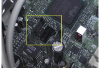
Fig 11 Interfaz serial ATA

Los cables IDE utilizan los conectores IDE de la placa base. Los cables SATA utilizan los conectores SATA de la placa base. Estos cables son diferentes a los