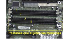
Fig 5 Ranuras de memoria

Se insertan en ranuras de la placa base que permiten almacenar los datos que se necesitan para el funcionamiento del sistema.