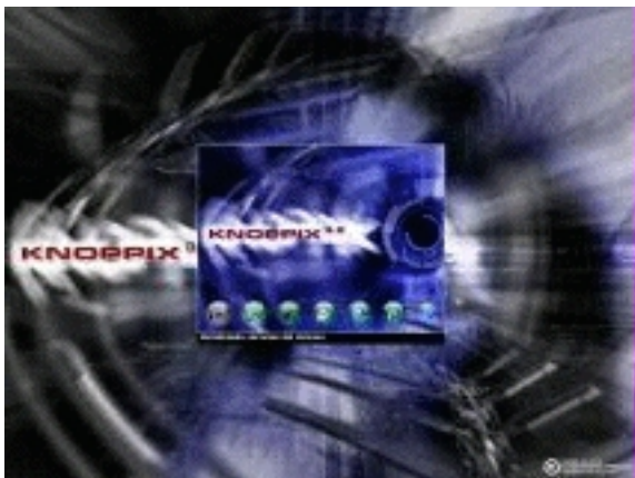
Imagen arranque Knoppix II

La distribución de Knoppix de Metadistros o la de Victor Alonso (al que agradezco su esfuerzo desde aquí) está configurada para que funcione en castellano desde el inicio sin tener que poner parámetros de configuración al inicio.