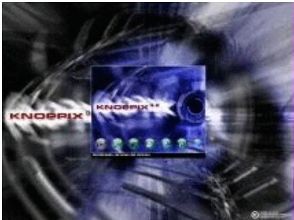
Imagen arranque Knoppix II

La distribución de Knoppix de Metadistros o la de Victor Alonso (al que agradezco su esfuerzo desde aquí) está configurada para que funcione en castellano desde el inicio sin tener que poner parámetros de configuración al inicio.