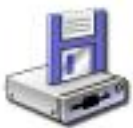
Disco de 3½ (A:)