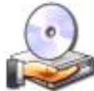
Unidad DVD-RW (D:)