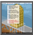
Fig. 21. Elección de la construcción