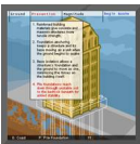
Fig. 21. Elección de la construcción