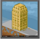
Fig. 24. Resultado del terremoto

5.1 Antes de empezar con el simulador de terremotos se pueden proponer a modo de introducción unas preguntas acerca de terremotos, como: