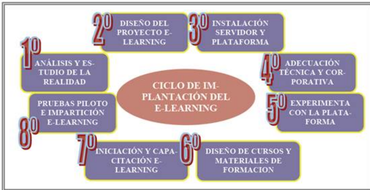
Imagen 1. Ciclo de Implantación E-learning. Sanchez (2007)

Un ejemplo claro del proceso a seguir para la implantación del e-learning en nuestra tarea diaria lo tenemos en el siguiente cuadro.