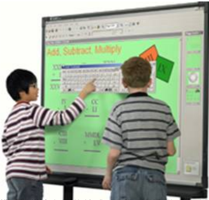
Historia de la tecnología educativa: desde los primeros dispositivos hasta los dispositivos de última generación

Written by Rosario Ortega Pérez Monday, 12 September 2011 17:22