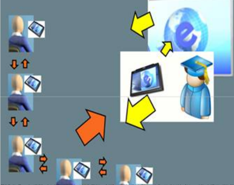
El uso de dispositivos móviles en el aula: ventajas y desventajas