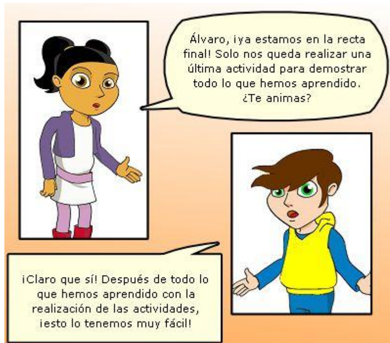
Ilustración. Actividad final.