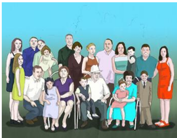
Ilustración. Descripción de personas. Fuente: Intef.

En esta secuencia didáctica se tratarán aspectos importantes sobre la descripción de personas. Partiendo de la definición de retrato literario, se conocerá desde las características de este, hasta la utilización de la comparación y la metáfora en este tipo de texto. A través de las actividades propuestas se reconocerá su estructura, lo que ayudará a su comprensión.