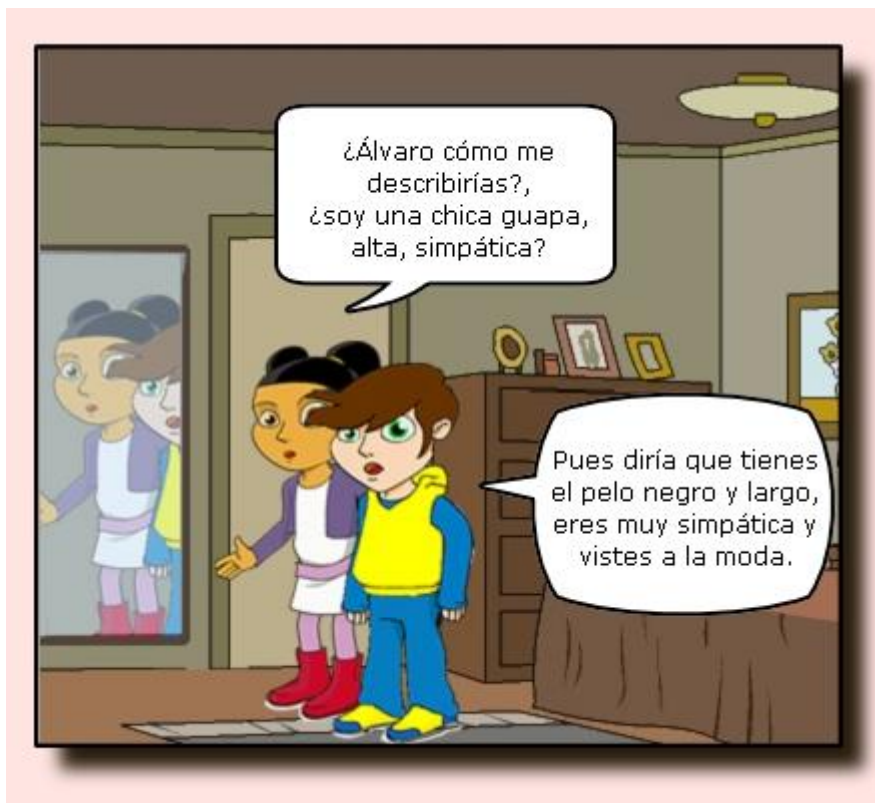
Ilustración. Describiendo a Susana.