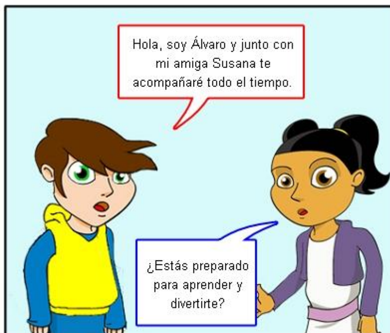
Ilustración. Álvaro y Susana.