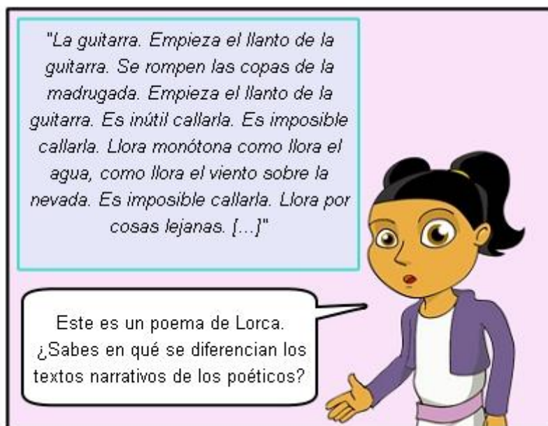
Ilustración. La guitarra.