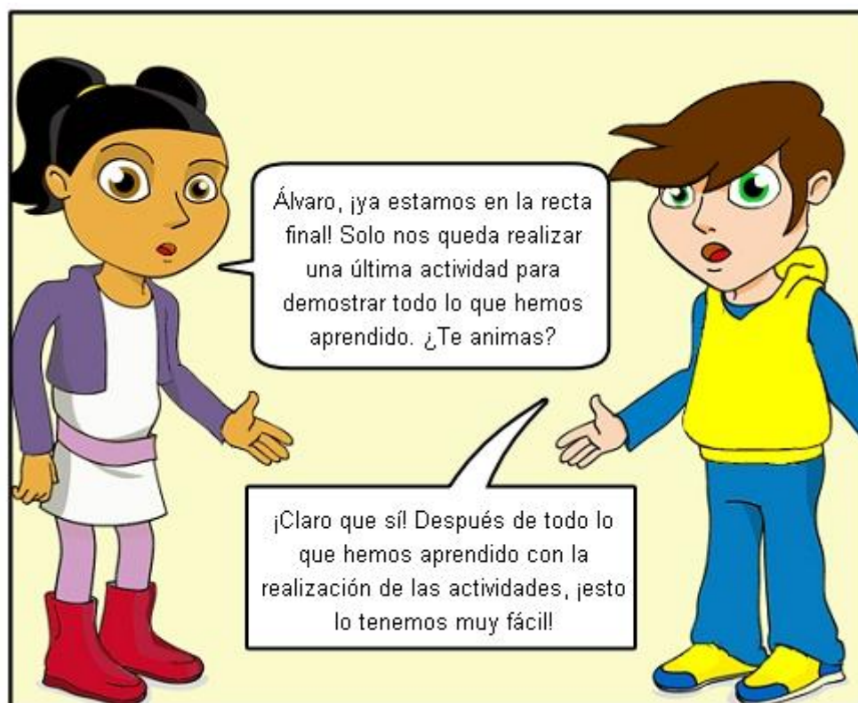
Ilustración. Actividad final.