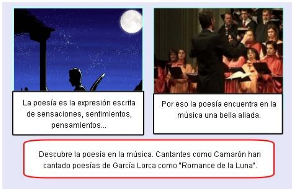
Ilustración. Poesía y música.