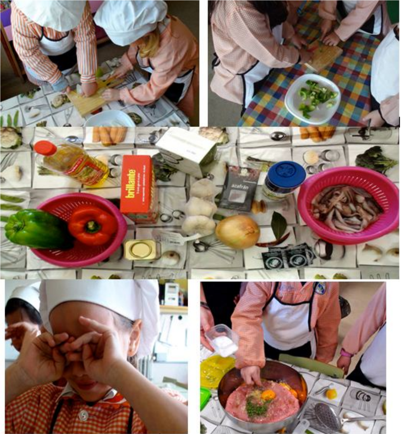
¿Por qué no se las cocinas? Este es el plato que se elabora en el programa de las cocinas saludables.

Escrito por María Piedad Avello Domingo, 17 de Febrero de 2013 23:39