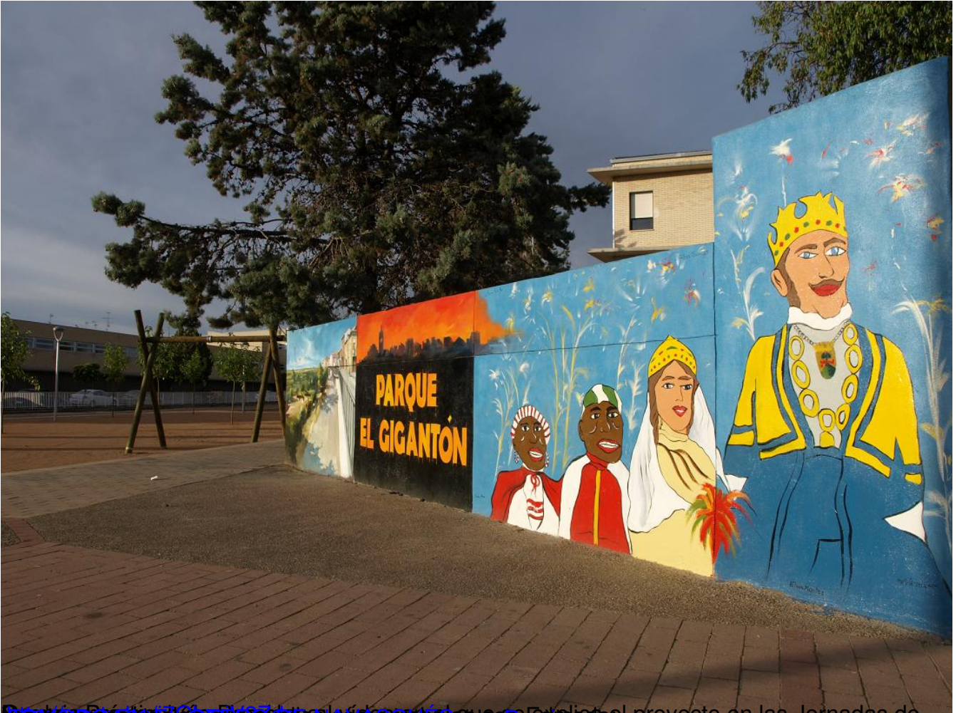
Ver el proyecto en el sitio web de la UIC que participa el proyecto en las Jornadas de Cultura y Arte de la UIC