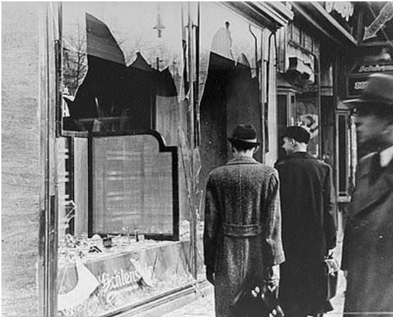
Destrucción de un establecimiento de propietarios judíos