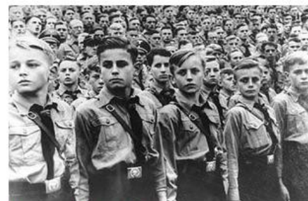
Crisis del 29 y Gran Depresión