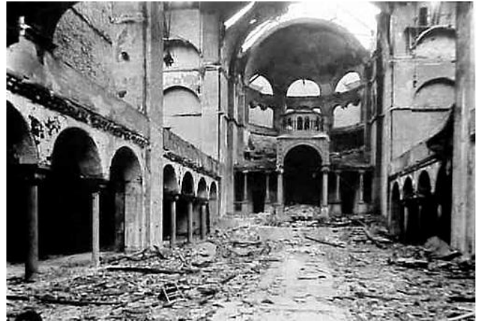
Incendio de la Sinagoga de la Fasanenstraße, Berlín