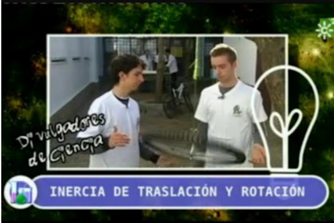
Año: 2014. Vídeo de Física: Alex y Santiago. Profesor: Sergio. Club de las Ciencias. Física divertida