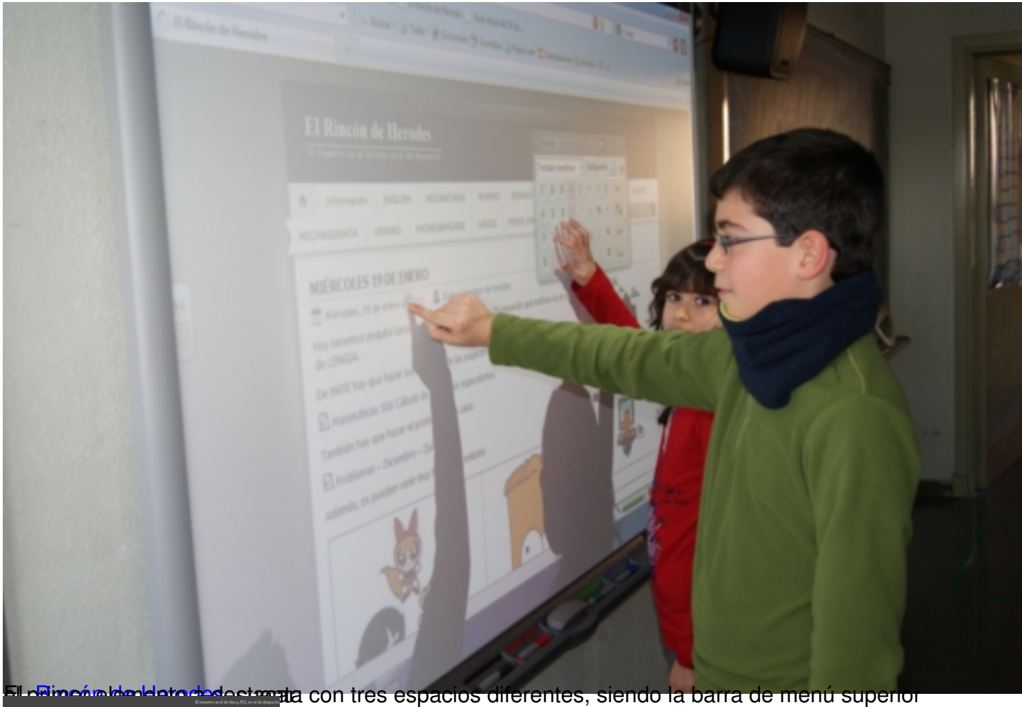
El Rincón de Herodes estrema con tres espacios diferentes, siendo la barra de menú superior

José Antonio Salgueiro González-k idatzia