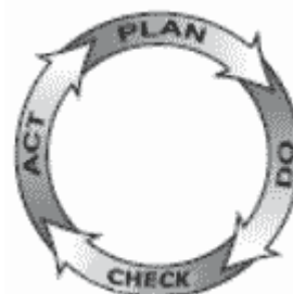
Fig. 1. Ciclo PDCA

A este conjunto de actuaciones, que es el mismo que se sigue en inmensidad de procesos y actividades diferentes, se le conoce como ciclo PDCA , o “ciclo Deming” llamado así en honor de Williams Edward Deming, aunque por justicia se debería llamar “ciclo Shewhart”, por ser este último, Water A. Shewhart, quien lo inventó.