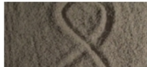
Las cifras, un viajero en el tiempo (Ep.3)