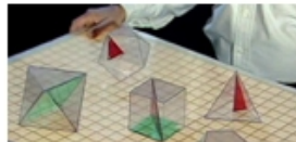
Euler, una superestrella (Ep. 4)

El universo de la matemática es un mundo fascinante y lleno de historias. Matemática es un lenguaje que nos ayuda a entender el mundo que nos rodea. Descubre más sobre la matemática en el mundo de la ciencia y la tecnología. ¿disfrutarla está en tu mano? Descubre más sobre la matemática en el mundo de la ciencia y la tecnología. ¿disfrutarla está en tu mano?