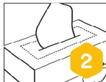
Bloque 2 - Unidad 2 La historia del...