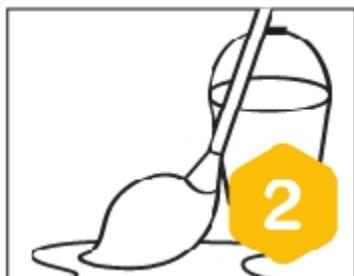
Bloque 2 - Unidad 1 ¿Quién inventó la...