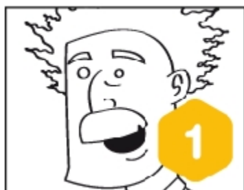
Bloque 1 - Unidad 1 La Aventura de FER