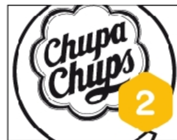
Bloque 2 - Unidad 5 El chupa-chups