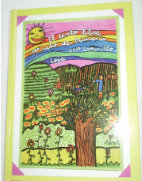
El texto libre. Fernando Savater. Págs. 1 y 2. Colección de Fernando Savater.