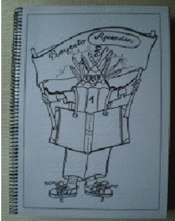
Proyecto Aprender de Primaria 2 de Primaria 5063N051A0286 páginas