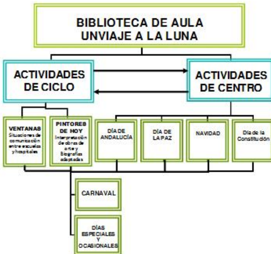
PANEL DEL RECORRIDO DEL VIAJE A LA LUNA