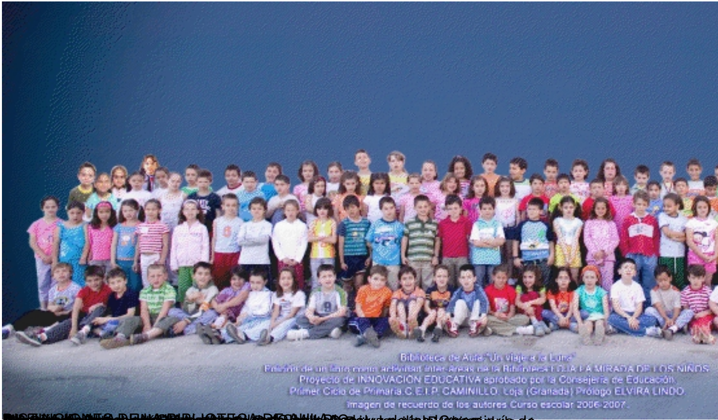
Biblioteca de Aula "Un viaje a la Luna" Resúmen de un fare común anPrácticas inter-áreas na Biblioteca ELA LA MIRADA DE LOS NIÑOS Proyecto de INNOVACION EDUCATIVA aprobado por la Consejería de Educación, Primer Ciclo de Primaria C.E.I.P. CAMINILLO, Loja (Granada) Prólogo ELVIRA LINDO. Imagen de recuerdo de los autores Curso escolar 2006-2007.

DISFRUTANDO DE LA BIBLIOTECA DESDE SU ESCUELA. De la editorial Comarcal de Cádiz,