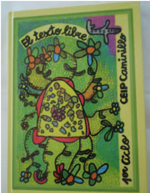
El texto libre. Mónica Sotomayor. Págs. 1 y 2. Colección de Juan de Loxa.