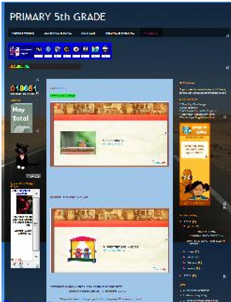
Blog de sexto: