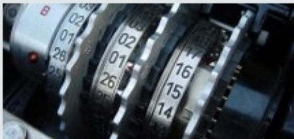
Si lo escondo, ¿lo encuentras? Aritmética del reloj