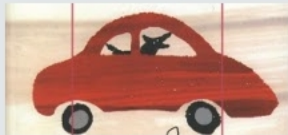
De la Literatura a las mates El incidente con +matemáticas