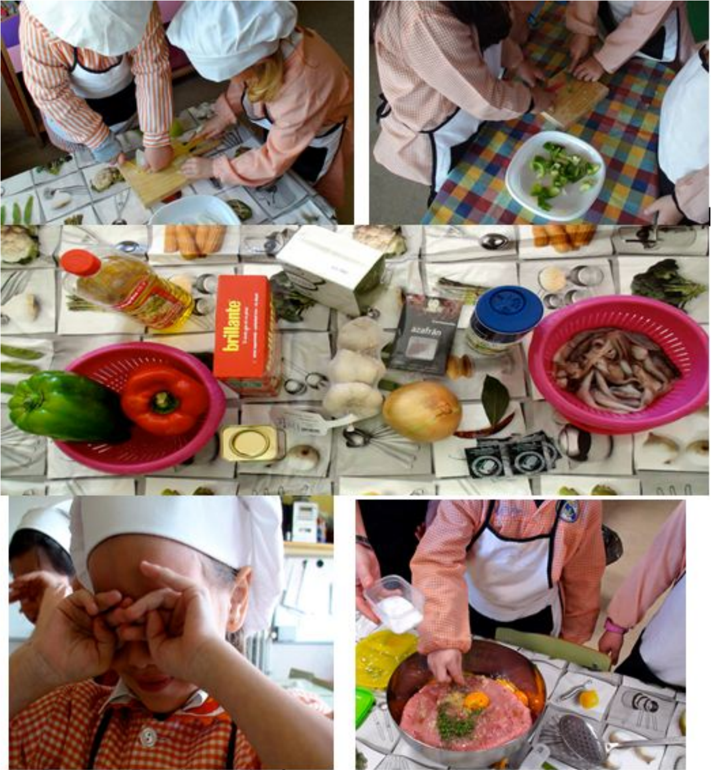
programa de las cocinas? Este de los niños/as se elabora un