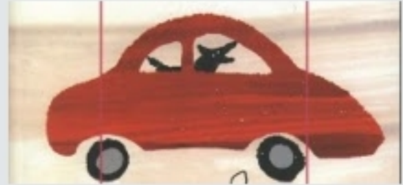
De la Literatura a las mates El incidente con +matemáticas