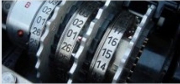
Si lo escondo, ¿lo encuentras? Aritmética del reloj