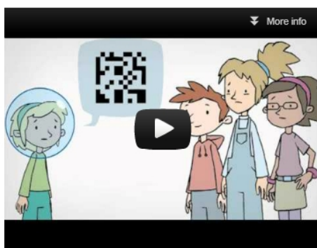
La escafandra de Clara.

Clara es una niña con un sueño: ir a la luna. Lo hará realidad gracias a la ayuda de sus amigos, especialmente de Pedro, un amigo muy especial. Juntos conseguirán viajar a la luna.